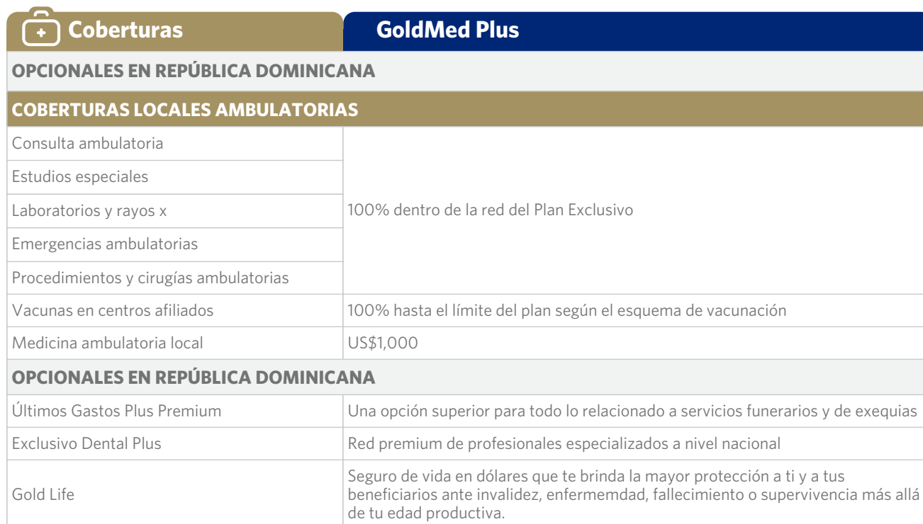
TABLA DE COBERTURAS