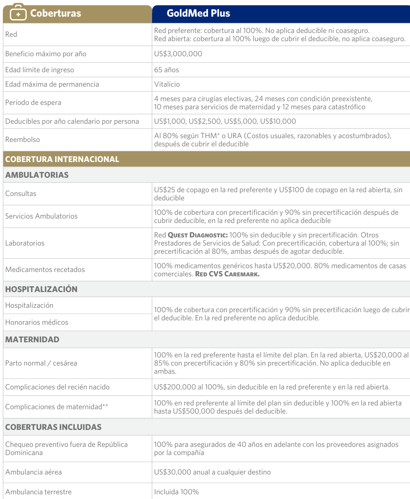
TABLA DE COBERTURAS